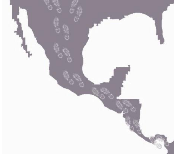
RED DH MIGRANTES

Para lograr los objetivos del Proyecto, se conformará una red de acción y colaboración entre organismos y organizaciones de derechos humanos como un mecanismo innovador de defensa translocal de los derechos de las personas migrantes.